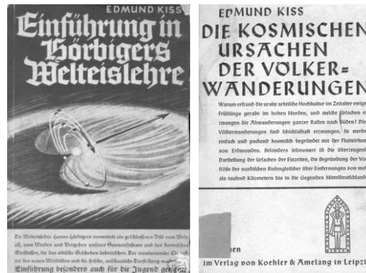
Portadas de las obras de Edmund Kiss Einführung in Hörbigers Welteislehre (1933) y Die Kosmischen Ursachen der Völkerwanderungen (1934).

De acuerdo a Kiss, la enigmática y fabulosa Puerta del Sol de Tiahuanaco -un bloque monolítico de lava gris de los Andes- es un sistema de cuenta dividido en doce partes y basado en caracteres ideográficos. El orden de lectura de los caracteres de la Puerta del Sol comienza en su parte superior central con la figura de la divinidad Tarapacá o Ticci Viracocha, con doce rayos proyectándose desde su cabeza. A los lados, treinta diferentes figuras antro-po-zoomorfas de expresión arcaica.